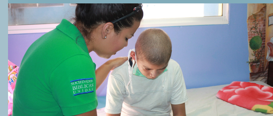
Forældre må ofte rejse hjem for at passe deres arbejde. Her træder de frivillige til med omsorg.