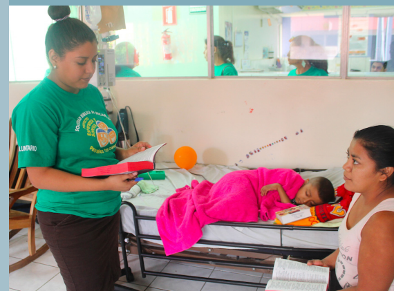
De bibelske fortællinger beroliger martrede sjæle.