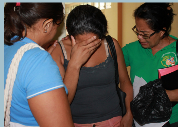
Det er hårdt at være besøgsven, for kemokuren er barsk ved børnene og forældrene bliver ofte ulykkelige. Det hænder, at børnene dør.

Samtidig får børnene tilbudt en afbalanceret kost, der styrker kroppen. Det fjerner også en masse bekymringer. Fattige forældre har sikker-