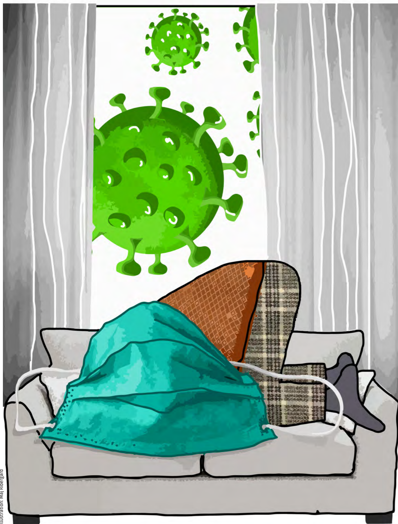
Illustration: Maj Ribergård